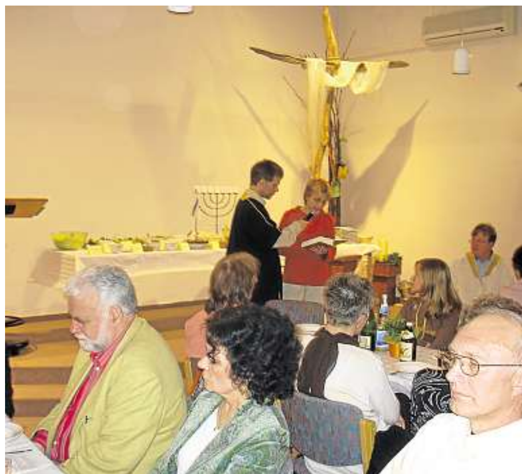
Die Feier des Passah-Festes in den Gemeinderäumen im Jahr 2009.

Samstag, 26. März: 9.30 Uhr Konfi-Tag, Jahrgang 2011/2012, Luther-Haus. Sonntag, 27. März: 9.30 Uhr Gebetskreis; 10 Uhr Gottesdienst mit Taufe, Pfarrer Kröger; 11 Uhr Konfi-Tag, Jahrgang 2010/2011, Luther-Haus. Montag, 28. März: 10 bis 12.30 Uhr Bücherspendenabgabe; 18 Uhr Funktionsgymnastik, Luther-Haus. Dienstag, 29. März: 16 Uhr Frauenabend „Kunst trotz(t) Demenz“, Domkirche; 19.30 Uhr Passionsandacht; 19.30 Uhr Vorbereitungstreffen Jubelkonfirmation, Notkirche. Mittwoch, 30. März: 8.30 bis 12.30 Uhr und 14.30 bis 16.30 Uhr Bücherspendenabgabe; 14.30 Uhr Seniorennachmittag, Luther-Haus. Donnerstag, 31. März: 14.30 Uhr Kinderchor Piano; 15.30 Uhr Kinderchor Mezzoforte; 16.30 Uhr Kinderchor Fortissimo; 17 bis 19 Uhr Bücherspendenabgabe; 18.30 Uhr Kirchenchor; 20 Uhr Chor Mosaik, alle Chöre in der Römerstraße 94 (Notkirche). Freitag, 1. April: 10 bis 11.30 Uhr Bücherspendenabgabe; 19 Uhr Jungbläser; 20 Uhr Posaunenchor. Samstag, 2. April: 13 bis 18 Uhr Büchermarkt, Luther-Haus.