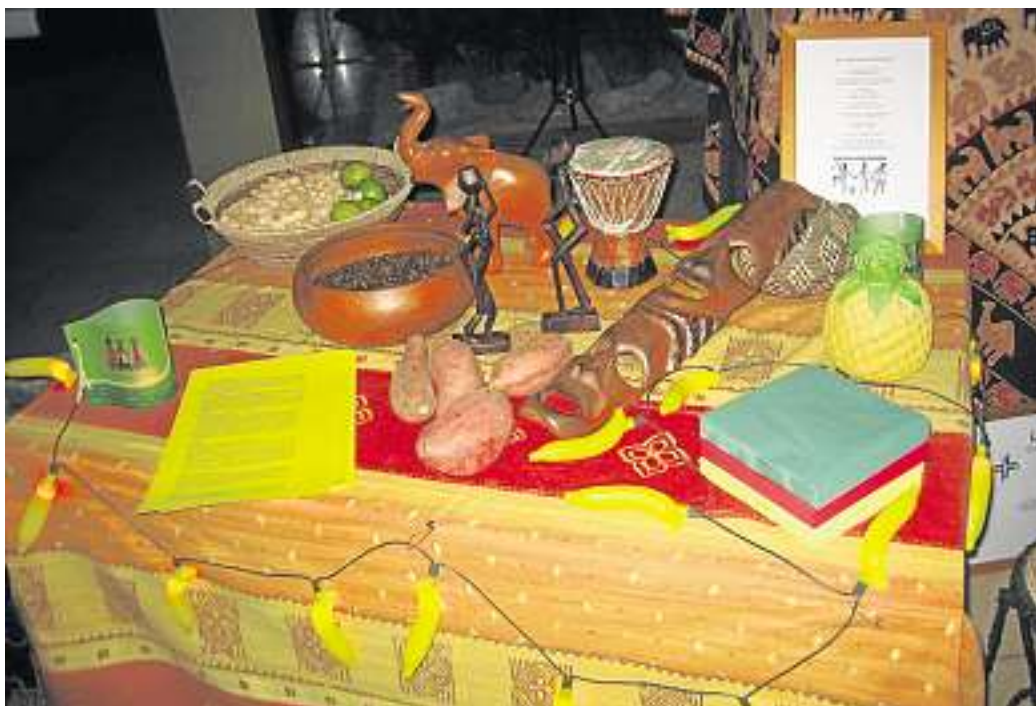
Letztes Jahr war in Neuschloß in der Kapelle am Waldfriedhof der Weltgebetstag „Kamerun“ mit afrikanischem Flair.

Für den redaktionellen Inhalt dieser Seite sind die Kirchengemeinden verantwortlich.